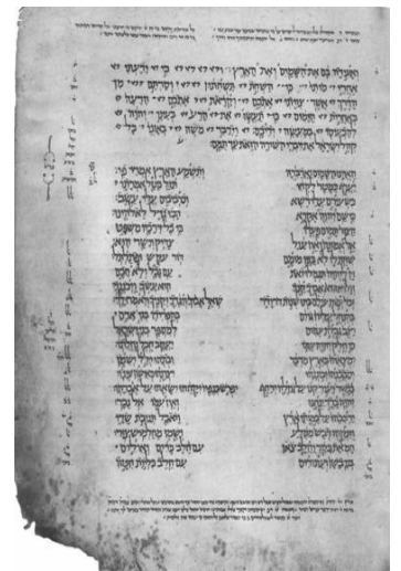
9. Maimonides' Code, הלכות ספר תורה (Huntington manuscript 80):

צורת האזינו כל שיטה ושיטה יש באמצעה ריוח אחד בעורת הפרשה הסתומה ונמצאת כל החלקה לשנים ופותח אותה בטבע ושנים שטות ואלו הן התיבות שבראש כל שיטה